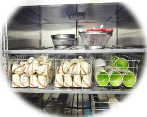
食器消毒乾燥機です