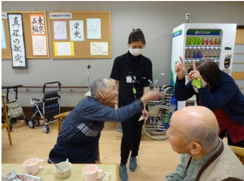
鬼は外（節分の豆まき）