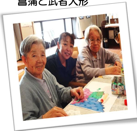
もうすぐ紫陽花の季節です