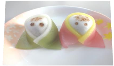
食べるの惜しい 和菓子です