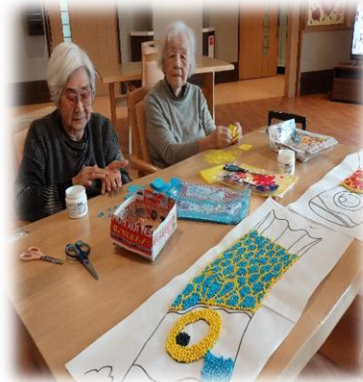
大きな鯉のぼりです