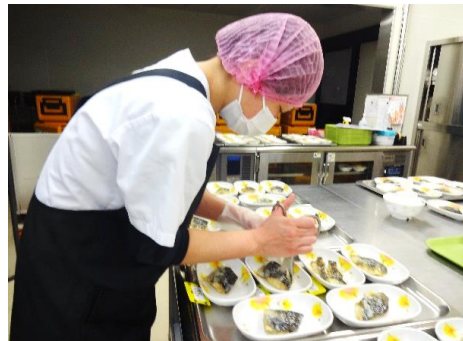
丁寧に盛り付けします