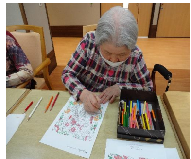
塗り絵を真剣にやっています