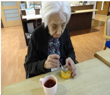
今日のおやつです

おやつ作りや外散歩、季節の行事を楽しんでいただけるよう職員一同取り組んでまいります。