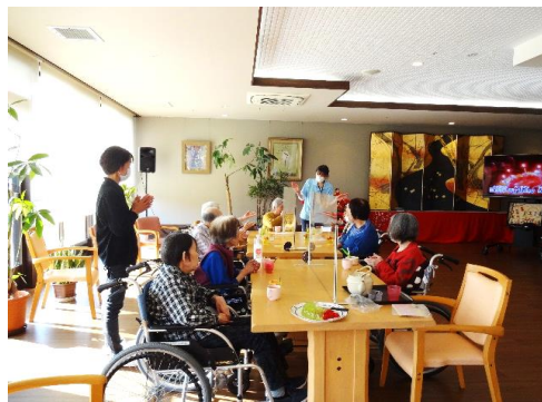
お誕生会の一コマ