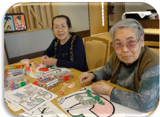
カーネーション、菖蒲、たんぽぽ 季節の花を飾りましょう