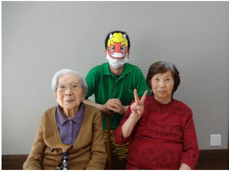
福を呼び込む記念撮影