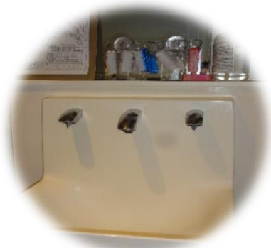
手は念入りに洗います

①感染媒体となる害虫駆除、②職員の健康管理、清潔管理、③清潔区画の保持、調理器具、機械の保守管理及び衛生管理、④食品保管における衛生管理などが行われています。