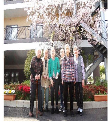
園庭の枝垂れ桜の下で