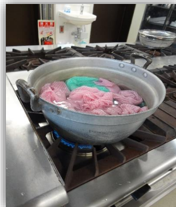
ふきんも煮沸消毒します