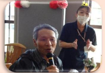
理事長より景品贈呈