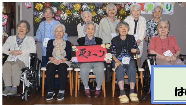
記念撮影 はい！チーズ！

富士見が丘いこいの園が50周年を迎える事ができました。 利用者様、ご家族様、関係機関の皆様、地域の皆様のお力添えに感謝しております。 今後ともよろしくお願い致します。