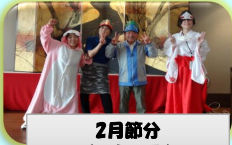
2月節分 うさぎと鬼と巫女さん