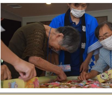
金魚すくいに一生懸命 何匹すくえたかな