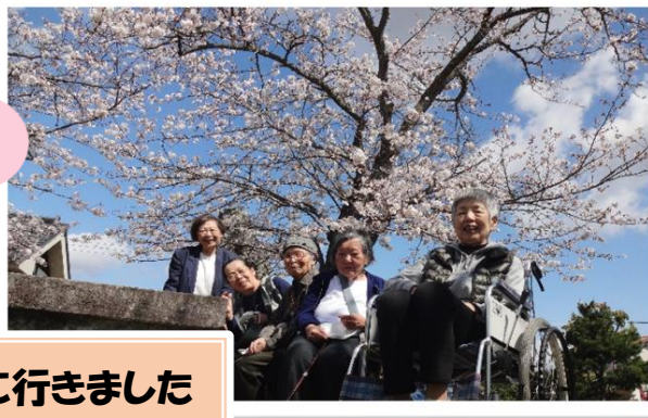
4月お花見に行きました