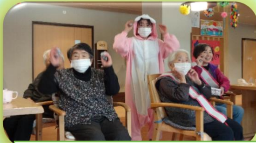
皆で鬼は外！福は内！