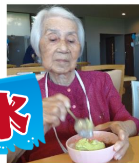
かき氷おいしいよ