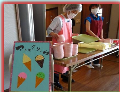
7月アイスクリームの日