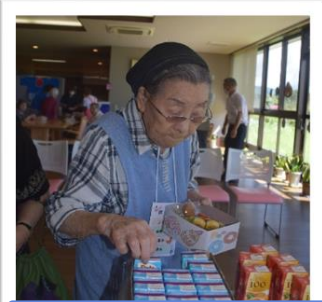
駄菓子屋さんで お菓子を選びます