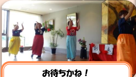
お待ちかね！ いこいの園 美女軍団の登場で 皆さんを盛り上げます