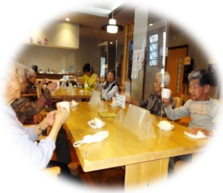
「コーヒー美味しいね」

令和4年はコロナの影響で行事、クラブ活動には、まだ縮小と制限があります。それでも徐々に開放の方向であります。