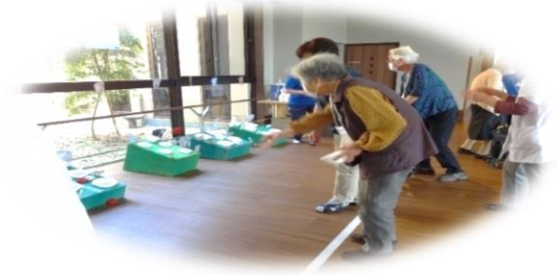
5/24ゲーム大会 「輪投げも真剣です」

今年2月と6月にお二人の女性が、百寿を迎えられました。百年という時の長さに生きてこられた時代の重みを感じられます。