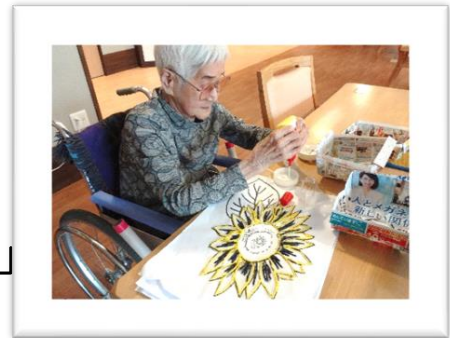
「夢中で貼り絵しています」