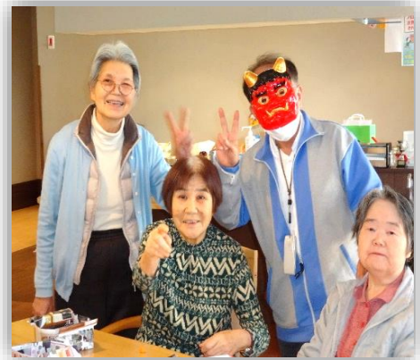
2月「鬼は外」でも、仲良くしてます