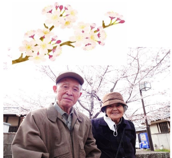
4月「満開の桜の下で」蛭ヶ小島にて