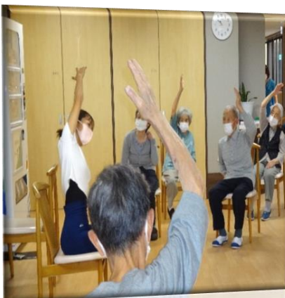
6/14「チェアヨガでストレッチ」